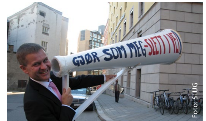
SLUG oppfordrer daværende miljø- og utviklingsminister Erik Solheim til å påvirke andre land til å slette illegitim gjeld. (2007)