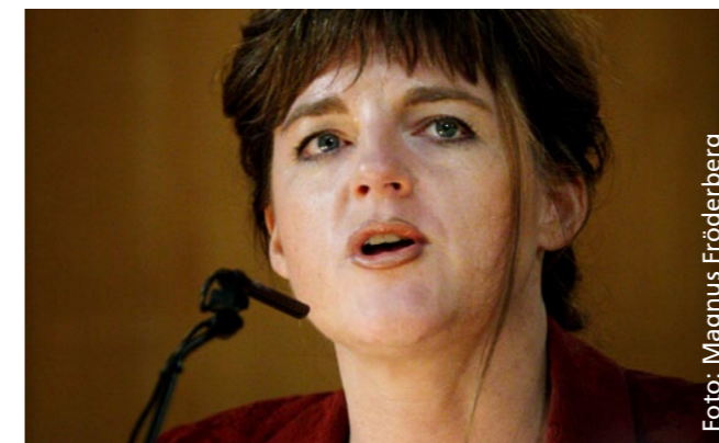
Illegitim gjeld ble en del av norsk politikk i den utvidede gjeldsplanen til Hilde Frafjord Johnson i regjeringen Bondevik II - Handlingsplan om gjeldsslette for utvikling (2004)