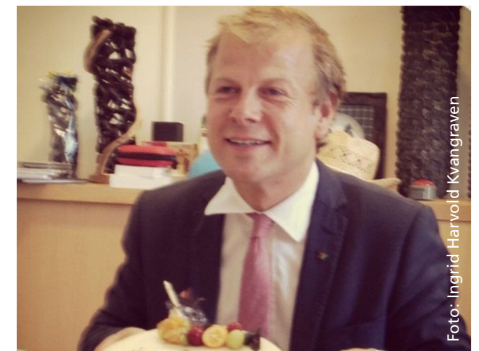
Heikki Holmås annonserer den norske gjeldsrevisjonen. (2012)