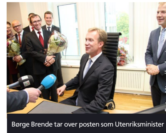
Børge Brende tar over posten som Utenriksminister

Mange norske bistandsorganisasjoner har grunn til å være skeptiske. Den nye regjeringen vil føre en utenrikspolitikk som først og fremst skal «sikre nasjonale interesser», og den har i sikte å gjennomføre store endringer i norsk bistandspolitikken. Men gjeldspolitikken bør ikke falle innunder bistand. Det handler om å rette opp i gamle feil og å bygge opp et internasjonalt system som forhindrer at slike feil gjentas. Heldigvis har det vært bred enighet blant norske partier om norsk gjeldspolitikken, og det er gode grunner til å tro at den blåblå regjeringen vil føre en ansvarlig gjeldspolitikken de neste fire årene. Spørsmålet blir om regjeringen vil opprettholde den initiativtakende rollen Norge har hatt de siste årene.