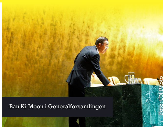
Ban Ki-Moon i Generalforsamlingen

De to siste årene har FNs Open Working Group (OWG), en gruppe i FN som består av nesten 100 land, laget et forslag til 17 nye bærekraftige utviklingsmål og 169 delmål. I løpet av 2015 kan dette dokumentet bli til verdenssamfunnets nye strategi for å utrydde fattigdom og skape bærekraftig utvikling. Her er noen av de mest fremtredende resultatene fra OWG-dokumentet som kan forme fremtidens utviklingsagenda: ►