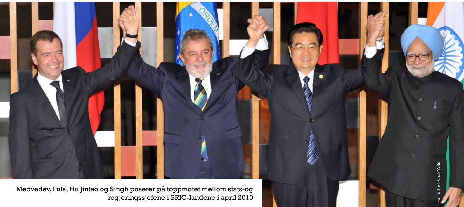
Medvedev, Lula, Hu Jintao og Singh poserer på toppmøtet mellom stats- og regjeringssjefene i BRIC-landene i april 2010