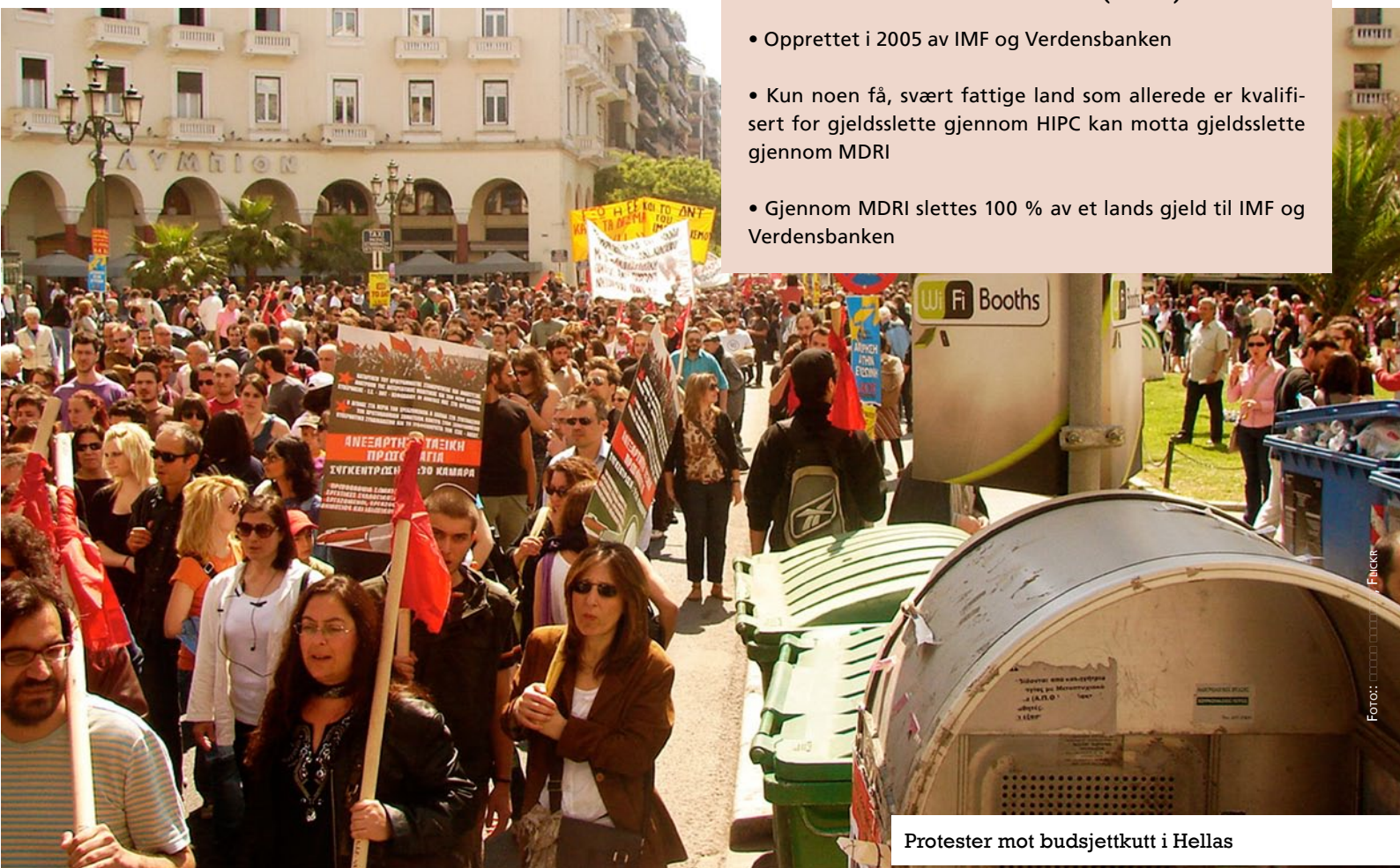
Protester mot budsjettkutt i Hellas