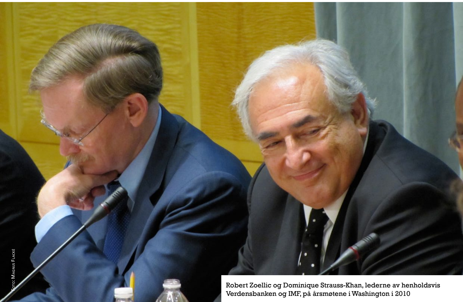
Robert Zoellic og Dominique Strauss-Khan, lederne av henholdsvis Verdensbanken og IMF, på årsmøtene i Washington i 2010