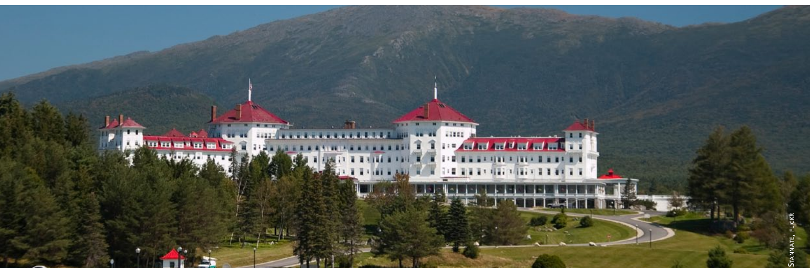
Bretton Woods, hvor IMF ble opprettet i 1944

Selv om man ikke med sikkerhet kan vite de faktiske konsekvensene nye styrestrukturer vil bringe med seg, mener de fleste sivilsamfunnsorganisasjoner at de nye reformene på langt nær er tilstrekkelige. Hverken lavinntektsland eller nye fremvoksende økonomier vil anerkjenne IMF som en autoritet så lenge USA sitter på vetomakt, og de europeiske landene er overrepresenterte og er garantert å få den neste lederstillingen. Mange alternative