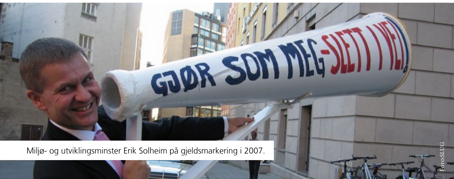
Miljø- og utviklingsminister Erik Solheim på gjeldsmarkering i 2007.

6 – Les mer på slettgjelda.no/Tema/Eksportkreditt