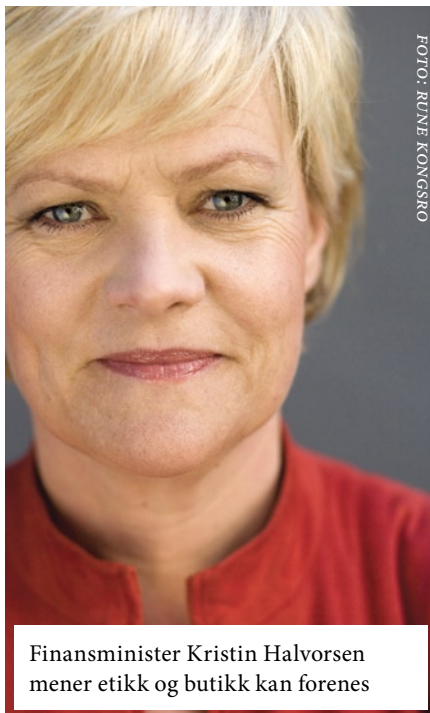
Finansminister Kristin Halvorsen mener etikk og butikk kan forenes